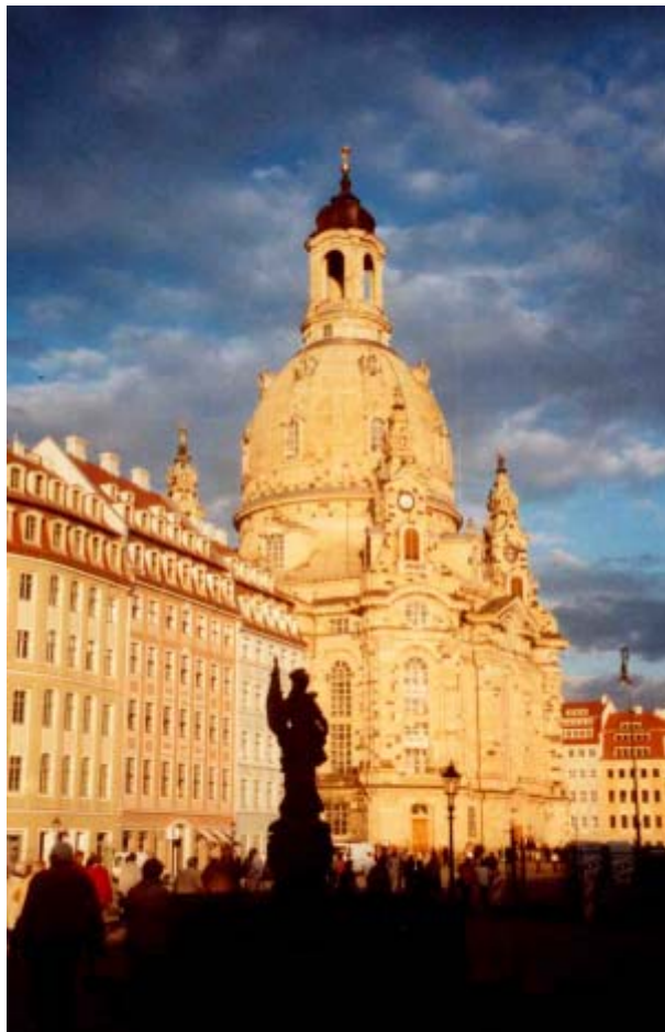
Frauenkirche im Abendlicht des ersten Besuchstages

Der erste erlebnisreiche Besichtigungstag geht zu Ende. Es ist 18 Uhr, die Abendglocken läuten. Das Innere der Kirche hatten wir auch noch gerade besichtigen können und waren überwältigt von der Leistung, die hier am dritten Kirchenbauwerk sichtbar wird, der heutigen „Frauenkirche zu Dresden“.