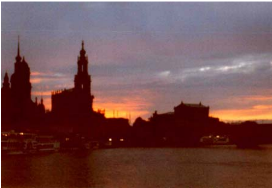
Abendstimmung am Dresdener Terrassenufer