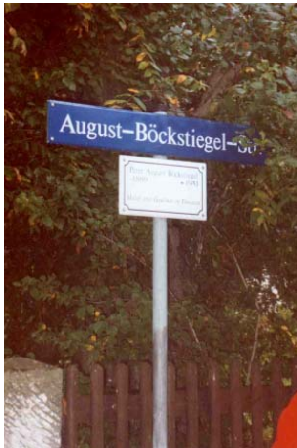
Straßenbezeichnung in Pillnitz zur Erinnerung an P.A.B.

Dass natürlich zum Ausklang der Erlebnistage ein gemeinsames Abendessen zur Krönung beigetragen hat, ist auch zu erwähnen: Am ersten Tag im Bistro des Taschenbergpalais, diesmal im Restaurant CHIAVERI im Sächsischen Landtag an der Elbe. Chiaveri hat den Auftrag zum Bau der Hofkirche erhalten und von 1738 bis 1743 die Bauleitung innegehabt. Erst 1755 war der Kirchenbau vollendet, 1945 bis auf Turm und Grundmauern zerstört. Nach Wiederaufbau wurde sie 1980 durch päpstliches Dekret zur Kathedrale des Bistums Dresden/Meißen erhoben.