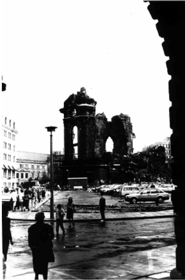
Trümmer der Frauenkirche im Jahre 1990

Im Gefolge des unendlichen Leids, das durch den Zweiten Weltkrieg über Europa hereinbricht, vernichtet der Bombenangriff und Feuersturm am 13. und 14. Februar 1945 auch die Frauenkirche. Bereits in den Kriegsjahren 1942 und 1943 war eine Sanierung notwendig geworden, wobei man eine genaue Bestandsaufnahme der Bausubstanz fertigen musste.